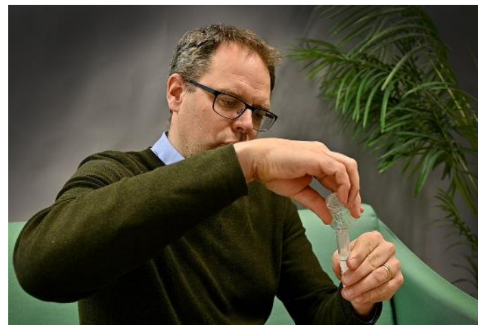
5. Spotta ut vattnet i koppen, håll över i röret.