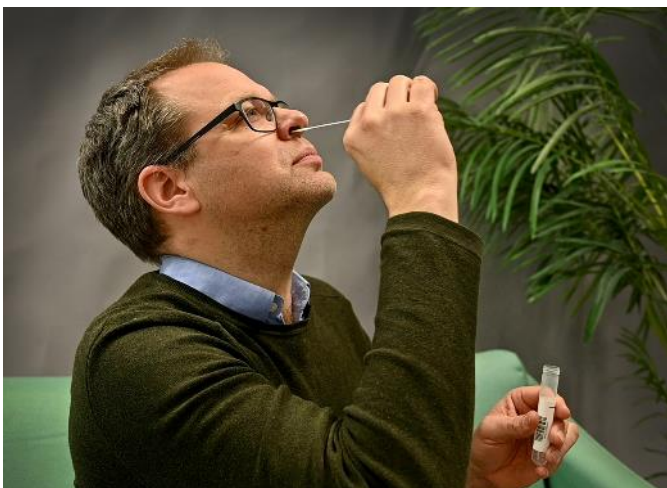
6. Ta prov från näsan med pinnen.