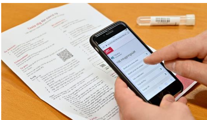
11. Logga in på 1177.se med e-legitimation.