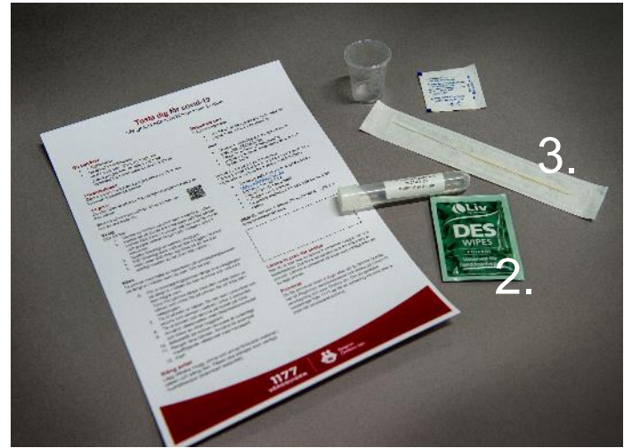
2. Sprita händerna med grön servett. 3. Öppna påsen med pinnen så att du lätt kommer åt den.