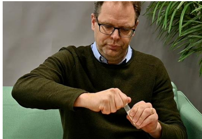
9. Skruva åt korken på röret.