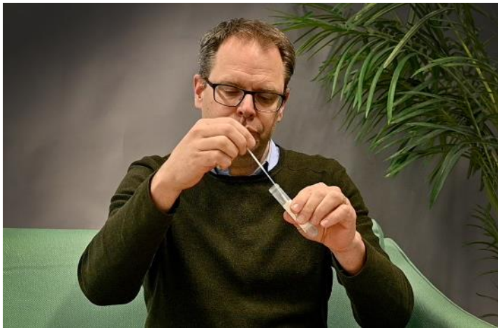
8. För ner pinnen i röret, snurra runt den i 3 sekunder.