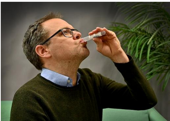
4. Harkla. Håll vattnet från röret i munnen. Gurgla längst bak i halsen i 3 sekunder.