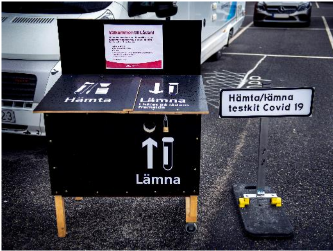
1. Hämta testkit från låda.