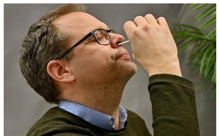
7. För in pinnen så långt du kan. Snurra pinnen 3 varv.