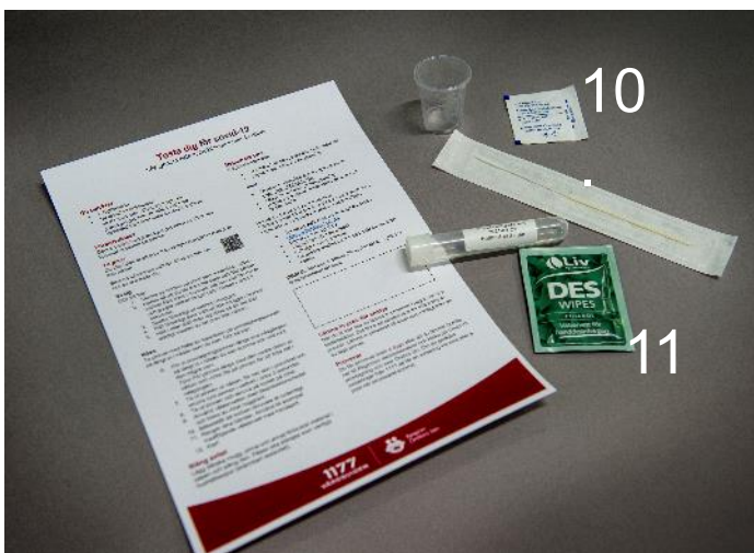
10. Torka av röret med vit servett.